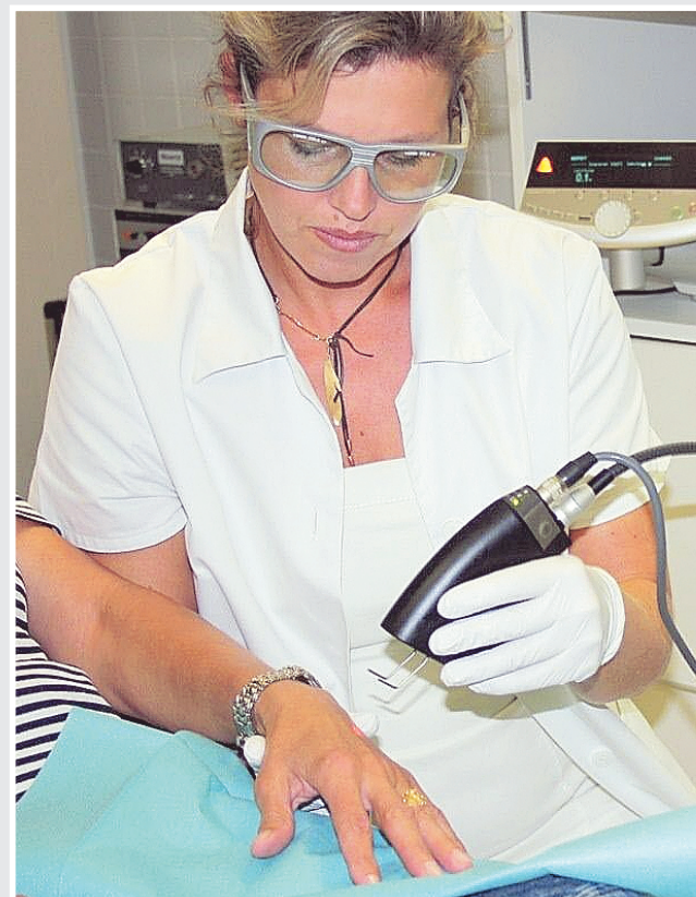
Anwendung gegen runzlige Handrücken

Wer sich mit diesen Veränderungen nicht abfinden will, kann viel zur optischen Verjüngung der Hände tun: Störende,